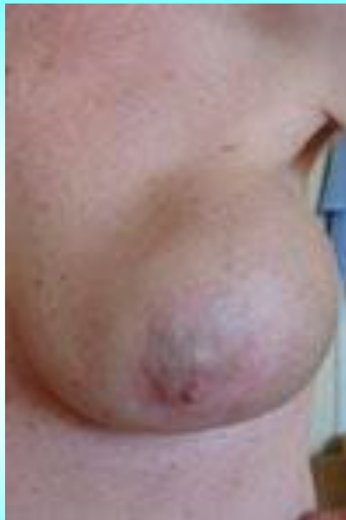
Деформация молочной железы