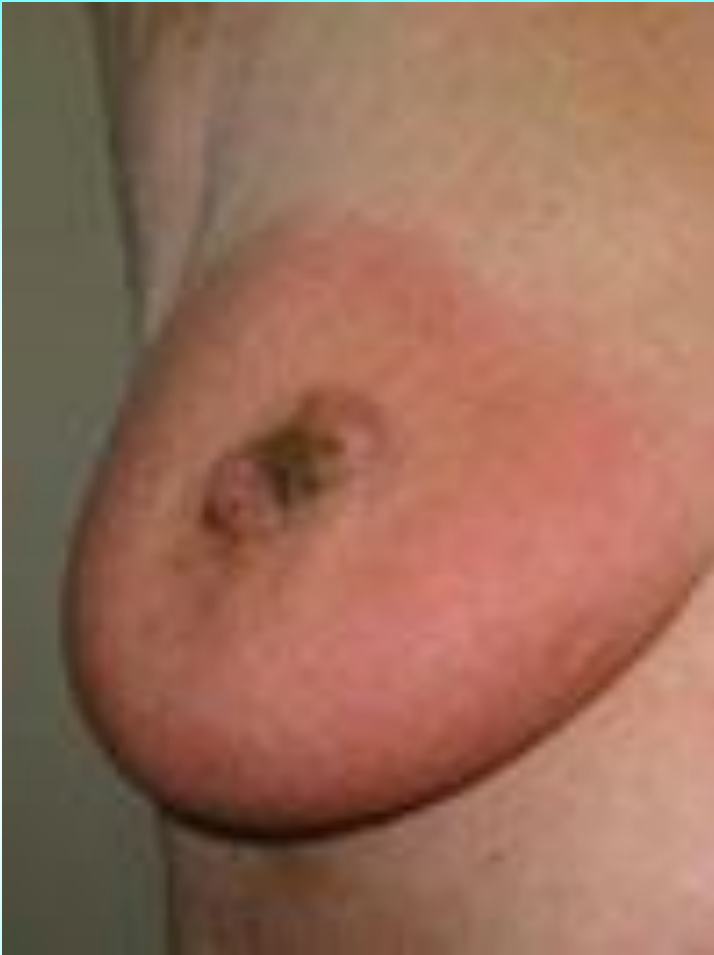
Покраснение кожи молочной железы